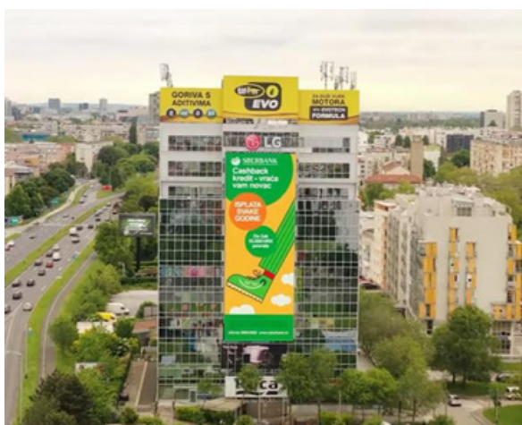
Afbeelding: HoloLab/ Kroatië