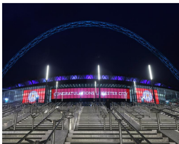
Afbeelding: Wembley Stadium / Verenigd Koninkrijk

Wij kunnen u helpen bij het leveren van de best mogelijke oplossing!